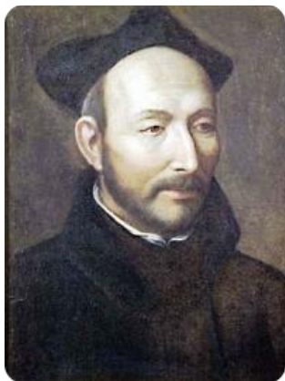
Loyolai Szent Ignác

Kik láthatóak az alábbi képeken? Keresd meg őket a betűk között, majd írd a kép alá a nevüket! (12 pont)