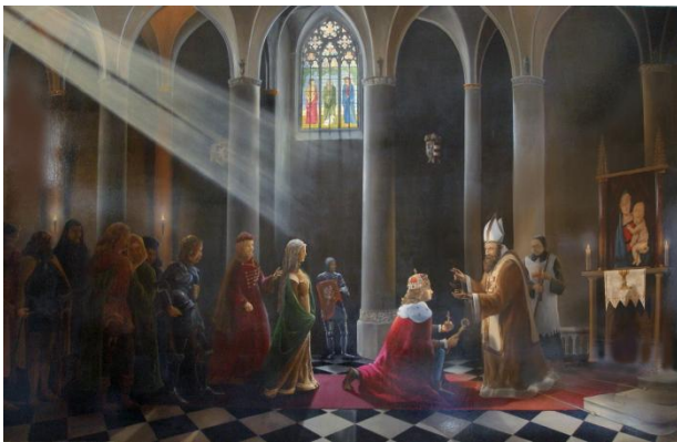
Hunyadi Mátyás megkoronázása