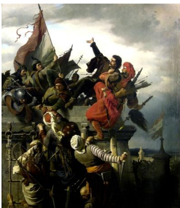
Dugovics Titusz hőstette